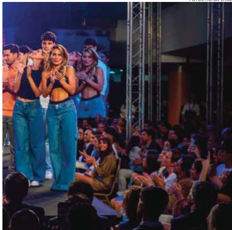
e muito talento

do mundo conquistaram uma legião de seguidores nas redes sociais. Reconhecido como o "evento do ano", o grande desfile cativou a atenção dos aficionados da moda, dos entusiastas das redes sociais e dos amantes da música, oferecendo uma experiência única e memorável. Durante mais de duas horas, o piso 0 do Palácio do Gelo Shopping foi palco de uma exibição surpreendente, onde os modelos da Best Models desfilaram com elegância e estilo, revelando as últimas novidades em moda masculina,