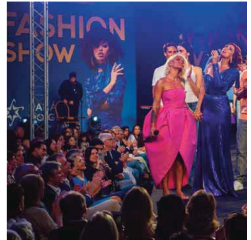
Catarina Furtado voltou a apresentar o evento que reuniu moda, música

O Palácio do Gelo Shopping, em Viseu, celebrou o seu 16.º aniversário com um espetáculo deslumbrante, que ficará marcado na memória de todos os presentes. Conduzido por Catarina Furtado, o tão aguardado "Palácio do Gelo Fashion Show 2024" transformou a noite de sábado numa montra de moda, música e entretenimento, onde desfilaram talentos, tendências e muita animação.