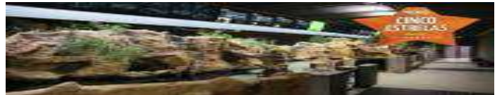
Fluviário de Mora galardoado com “Prémio Cinco Estrelas Regiões 2023”! (/ultimas/regional/fluviario-de-mora-galardoado-com-premio-cinco-estrelas-regioes-2023)

« Tradição das Marchas Populares mantém-se em Montemor-o-Novo (c/fotos) (/ultimas/regional/tradicao-das-marchas-populares-mantem-se-em-montemor-o-novo-c-fotos)