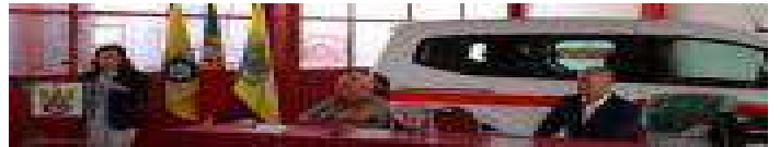
Apresentação do Plano de Desfibrilhação Automática Externa aconteceu dia 31 em Mora (/ultimas/regional/apresentacao-do-plano-de-desfibrilhacao-automatica-externa-aconteceu-dia-31-em-mora)