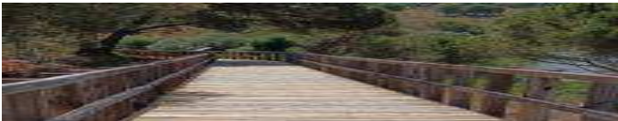
Mora: Manutenção no Passadico do Parque Ecológico do Gameiro (/ultimas/regional/mora-manutencao-no-passadico-do-parque-ecologico-do-gameiro)