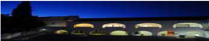
Município de Mora assinala Dia de Portugal com Espetáculo “Os Poetas de Amália” (/ultimas/regional/municipio-de-mora-assinala-dia-de-portugal-com-espetaculo-os-poetas-de-amalia)