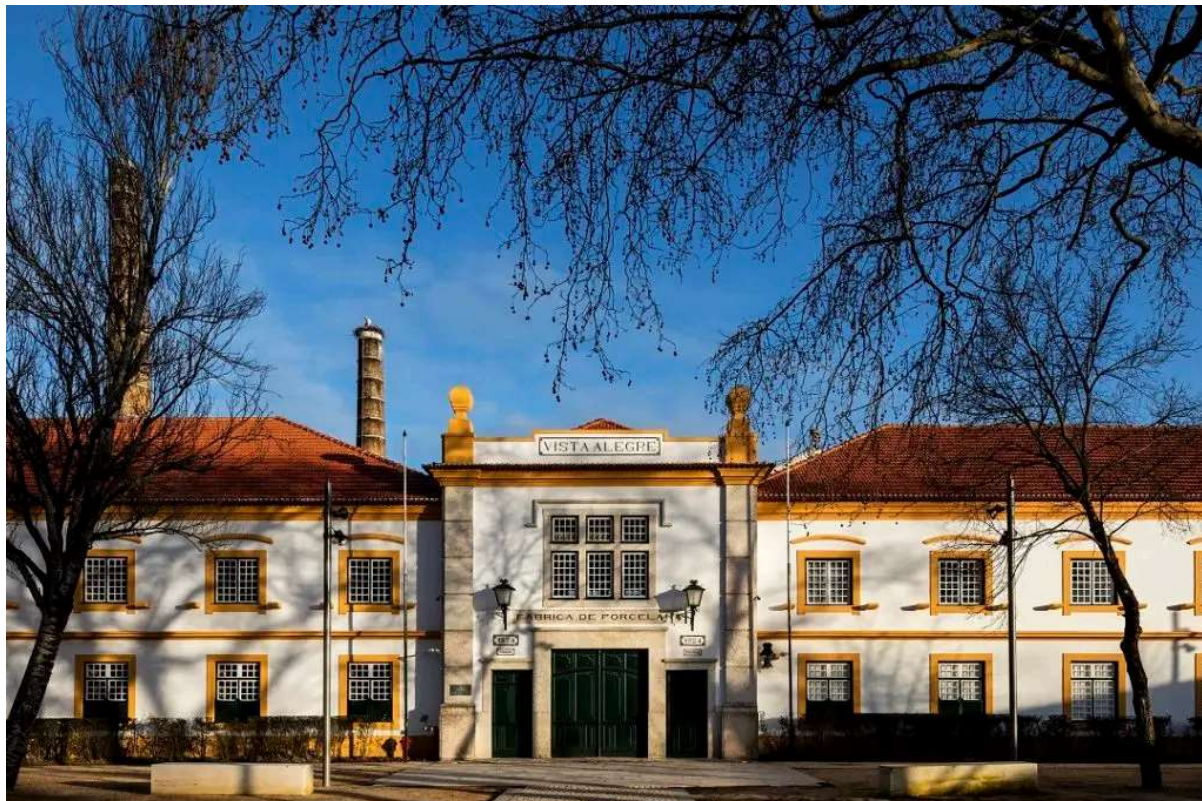
Fábrica da Vista Alegre

contribui para a observação da paisagem e para maior fluidez no percurso de quem passeia pelo Passadiço entre as praias da Barra e da Costa Nova.