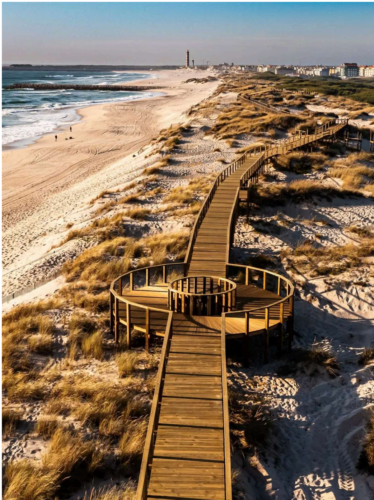
Passadiço entre as praias da Barra e da Costa Nova

O passadiço da rotunda Tem pouco mais que um quilómetro, liga o Farol da Barra à Costa Nova, e foi construído para recuperar e estabilizar o cordão dunar, protegendo o litoral e as suas populações dos riscos da erosão costeira. Com várias entradas ao longo das praias, é perfeito para o birdwatching e para o usufruto da Natureza, uma vez que foram plantadas espécies autóctones que contribuem para a fixação das areias na duna. Tem a particularidade de ter uma rotunda a meio, que