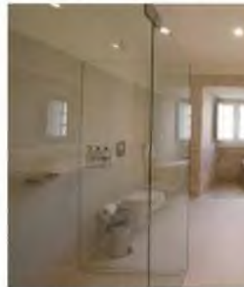
Traços de património histórico convivem com

A tempo de albergar parte da mostra de doces conventuais, vai ser inaugurado este sábado o Montebelo Mosteiro de Alcobaça Historic Hotel, instalado no conjunto monástico da abadia alcobacense. Resultado de um investimento de 18 milhões de euros, o hotel de 5 estrelas, explorado pelo Grupo Visabeira, ocupa o Claustro do Rachadouro e espaços envolventes. Ali, até final do século passado funcionava o Lar Residencial de Alcobaça. Com assinatura do arquiteto Eduardo Souto Moura, foi declarado o compromisso de não serem efetuadas muitas alterações no edifício original. Porém, as obras para instalação do novo hotel conduziram à inclusão do Mosteiro de Alcobaça na lista da UNESCO dos monumentos Património Mundial em risco.