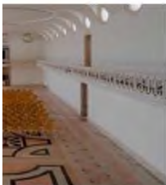
Salão de Alcobaça convertida em amplo salão