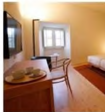
Uma das suítes do estabelecimento hoteleiro

Este estabelecimento hoteleiro é fruto de um contrato de concessão, válido por 50 anos, entre a Direção-Geral do Património Cultural e a Visabeira Turismo, assinado em junho de 2016, sendo pago ao Estado uma renda anual de 5 mil euros.