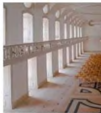
A magnífica sala da famosa livraria do Mosteiro