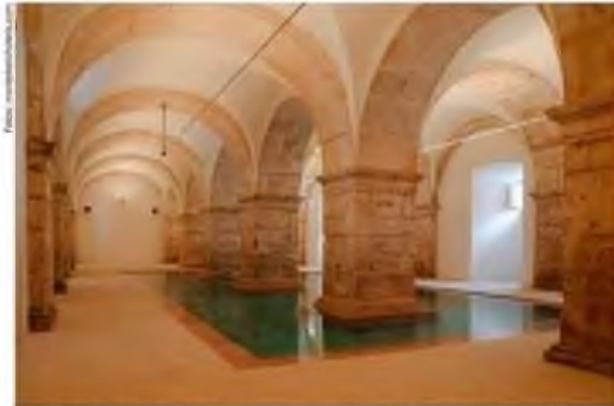
O hotel dispõe de piscina interior em espaço evidentemente patrimonial