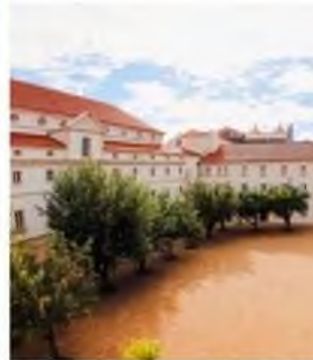
As unidades de alojamento distribuem-se em