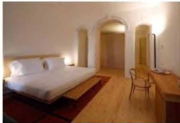
Um dos quartos do novo hotel