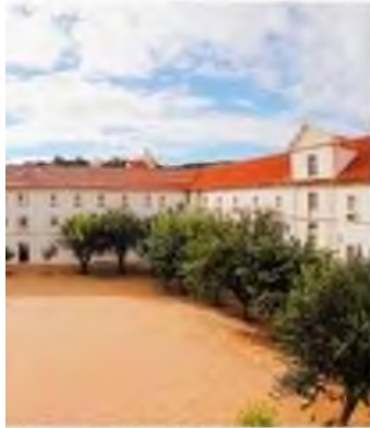
Exterior do Claustro do Rachadouro